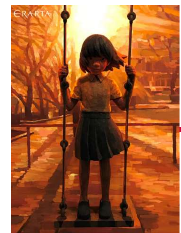
Качели на фоне заката Синтаро Охата Знакомьтесь тут в 16:00 и 18:30