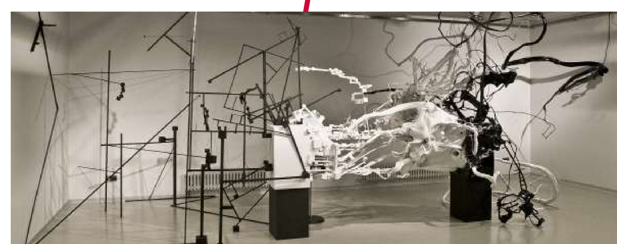
Модель биполярной активности Дмитрий Каварга Знакомьтесь тут в 13:00 и 16:30